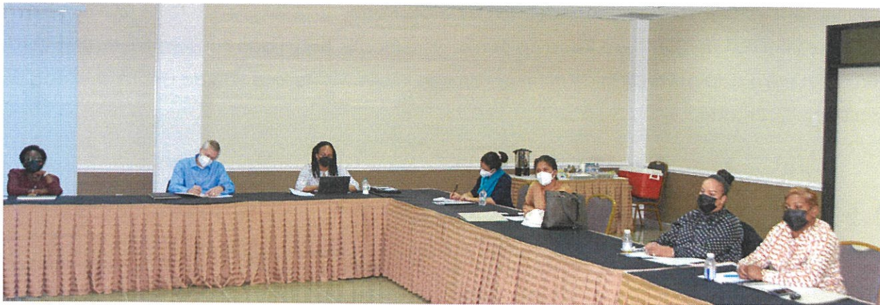
Delegatie van internationale waarnemers tijdens de Statenverkiezing van 19 maart 2021

De Raad heeft middels de lokale media binnen- en buiten de verkiezingsperiode met de burger gecommuniceerd over de uitvoering van zijn taken. Dit behoeft meer regelmaat en uitgewerkte programma van voorlichting over de Electorale Raad.