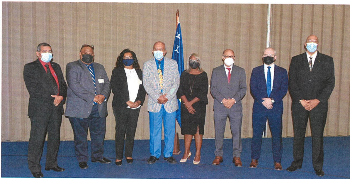
De leden en secretaris van de Electorale Raad

De ware betekenis van verzelfstandiging van de Electorale Raad is het kunnen ervaren dat onze democratie volwassen en ook internationaal is geworden. We zagen het afgelopen jaar dat het vertrouwen in het verkiezingsproces hoog is, maar ook onder druk staat en geen vanzelfsprekendheid is. Investeren in de onafhankelijkheid en onpartijdigheid van een electorale organisatie is van cruciaal belang om de toekomst weerbaar, betrouwbaar en uitvoerbaar te houden. De leden van de Electorale Raad hebben vooralsnog een groot aandeel in de realisatie van de verkiezing gehad. Het is echter duidelijk dat in de nieuwe opzet het Secretariaat van de Raad, mits met de nodige financiële middelen, een functionele en toereikende bezetting en een eigen kantoor, de operationele en tactische taken moet overnemen. Dit betekent een duidelijke omslag in werken en denken en vereist een verruiming van het budget als voorwaarde.